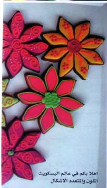
اهلا بكم في عالم البسكويت الملون والمتعدد الاشكال