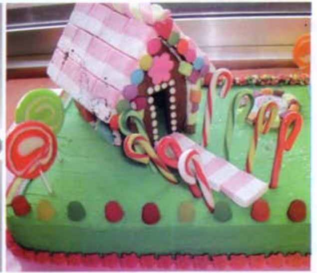
احلام الاطفال على ايقاع الالوان والاشكال

مناسبة وتقديمها بقالب جميل. وهي تستوحي بعض الموديلات والالوان من الكتب والمجلات والانترنت والاقمشة، كذلك تستوحي افكارا وموديلات جديدة خلال جولاتها السياحية المختلفة، انها تحب عملها كثيرا كونه يذكرها بطفولتها، تعطيه من ذاتها، وتخصص له معظم وقتها، تعمل في منزلها الخاص في بيروت، وتبيع حلوياتها الى بعض المحلات المعروفة، كما تصدر قطع البسكويت الى بعض الدول العربية. وعندما حصدت نجاحا كبيرا هناك، تلمح اليوم لتوسيع اعمالها في الخارج، من خلال موقع الكتروني باسمها. كذلك ترغب مستقبلا بنقل عملها الى مكان مستقل عن المنزل. حيث تفتح مطبخا لتحضير الحلويات ومحلا لاستقبال الزبائن. ●